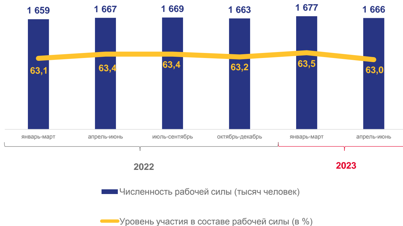
Динамика численности рабочей силы